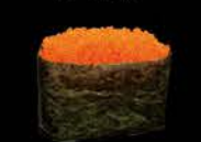
108 Masago gunkan Viseltjes, fish eggs € 1.20