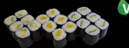
Menu 1 6 stuks komkommer maki 6 stuks pickels maki 6 stuks avocado maki € 7,50