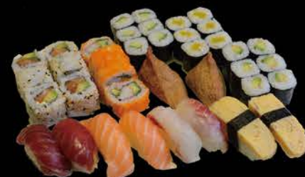
Menu 5 / 38 stuks 4 stuks california roll 6 stuks sake avocado roll 6 stuks avocado maki 6 stuks komkommer 6 stuks pickels 2 stuks tonijn nigiri 2 stuks tamago nigiri 2 stuks dorado 2 stuks zalm nigiri 2 stuks tofu buidel nigiri € 34,00