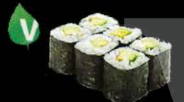
111 Avocado maki Avocado € 3.00