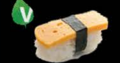
107 Tamago Zoete omelet, sweet egg € 1.20