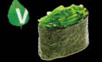
109 Wakame gunkan Zeewier, seaweed salad € 1.20