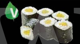
112 Pickels maki Pickle € 3.00