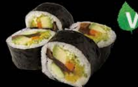
123 Futo vegi Roll Zeewier, komkommer, avocado, augurk en tamago Seaweed salad, cucumber, avocado, pickle, sweet egg Per 4 stuks € 4.50