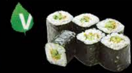
110 Kappa maki Komkommer, cucumber € 3.00