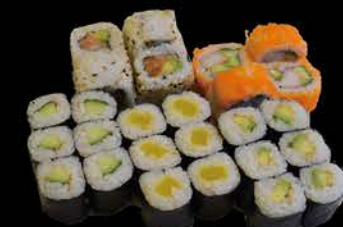
Menu 2 6 stuks komkommer maki 6 stuks avocado maki 6 stuks pickels maki 4 stuks california roll 4 stuks sake avocado roll € 14,00